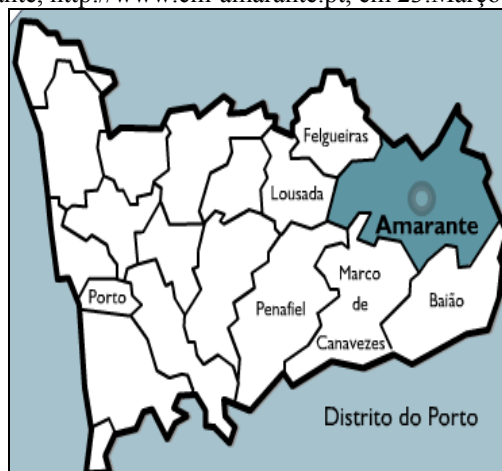
Figura 3 – Localização do concelho de Amarante no distrito do Porto

Embora funcionando como uma unidade em termos de planeamento das actividades curriculares, estas três escolas têm características diferentes em termos de dimensão e de recursos, como se pode verificar na tabela 1, na qual se apresenta uma síntese dos principais elementos caracterizadores considerados neste estudo.