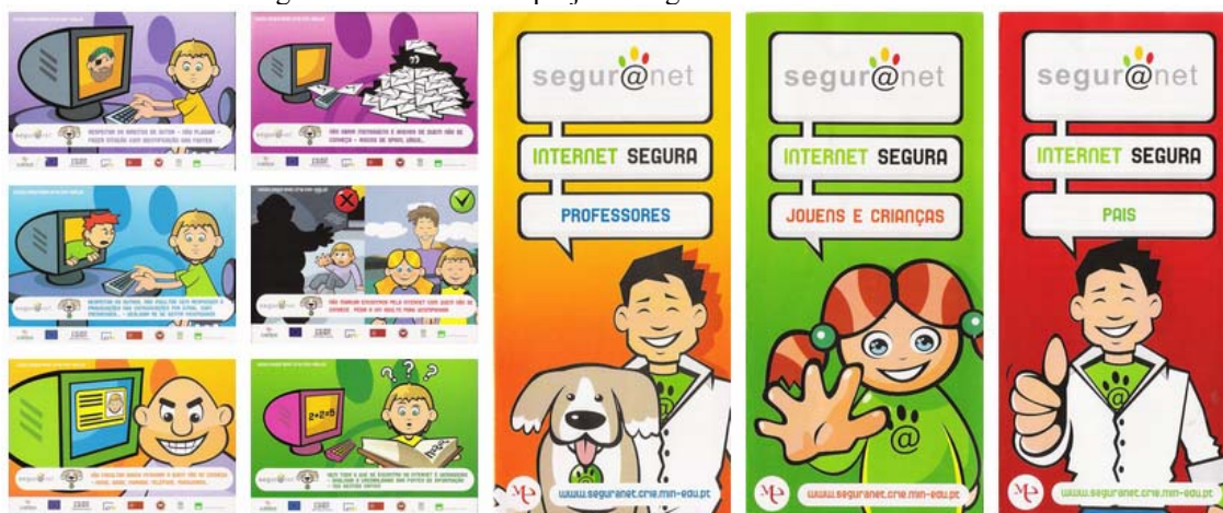
Figura 4 – Materiais do projecto SeguraNet enviados às escolas

Na figura 4 representam-se alguns dos materiais concebidos no âmbito do projecto