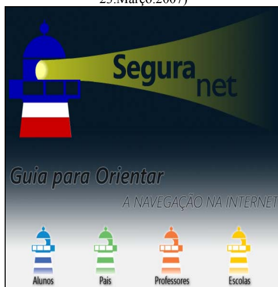
Figura 2 – Imagens da animação de entrada do sítio web do projecto Seguranet – fase de 2007 (URL: http://www.seguranet.pt em 23.Março.2007)

No âmbito do seu envolvimento no projecto SeguraNet, o C.C.U.M. levou a cabo um estudo de caso centrado na análise do processo de implementação de um conjunto de actividades visando a promoção de práticas seguras de utilização da Internet. O estudo focaliza-se nas actividades desenvolvidas por duas turmas do 4.º ano de escolaridade do “Agrupamento de Escolas de S. Gonçalo” e na compreensão do impacto dessas actividades na comunidade educativa. É sobre a apresentação deste estudo e as principais conclusões/lições daí decorrentes que se desenvolverá o corpo deste texto.